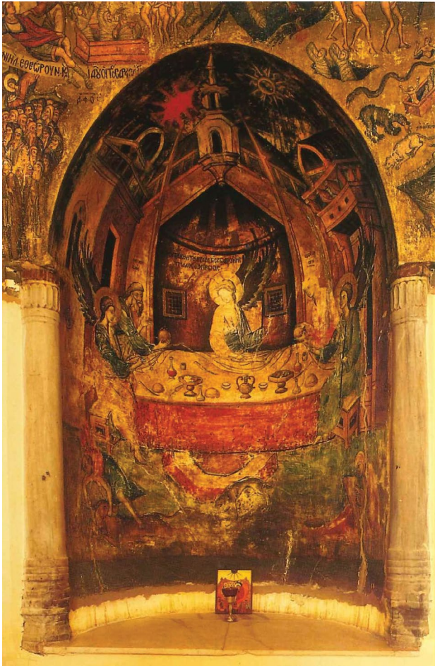
Сл.1. Гостољубље Аврамово, стара трпезарија манастира Свете Катарине на Синају (1577) Hospitality of Abraham, old refectory of the St. Catherine Monastery on Sinai (1577)

Поменути епитет означава Бога у телу, „Онога који јесте,“ за којег се у Откривењу каже: „Ја сам Алфа и Омега“ и односи се на Бога који свиме влада, Који је беспочетан и бесконачан, „Који јесте и Који беше пре свега, савечан Оцу и бескрајан, Који ће стога свакоме дати плату за његова дела“ (Otkr 1:8; Migne 1863, 225C–D). Објашњење Андреја Кесарејског на овај начин тумачи изузетну појаву небеских светила у синајској сцени Гостољубља, као и другу – ипостас Свете Тројице и потврђује снажна есхатолошка назначења ове сцене на која и иначе указује суседна сцена Страшног суда у форми развијеног циклуса.