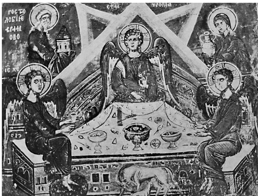
Сл.3. Гостољубље Аврамово, Богородичина црква, Драгаљевци (1476) Hospitality of Abraham, the Church of the Mother of God, Dragaljevci (1476)

Када је у питању значење ове фреске у Драгутиновом параклису, односно разлози њене појаве, разложно је да се и она протумачи у истом идејном контексту, као и фреска у старој трпезарији цркве Свете Катарине на Синају – као слика есхатона и Страшног суда. У овом смислу, као изузетно важна и сликаним програмом објашњена аналогија сцени Гостољубља у Драгутиновом параклису, показује се истоимена композиција у припрати цркве Успења Пресвете Богородице у Драгаљевцима код Софије (1476; sl. 3; Subotić 1980, 118–123, crt. 89–97, sl. 91; Bogoevska Capuano 2015, 94.309).