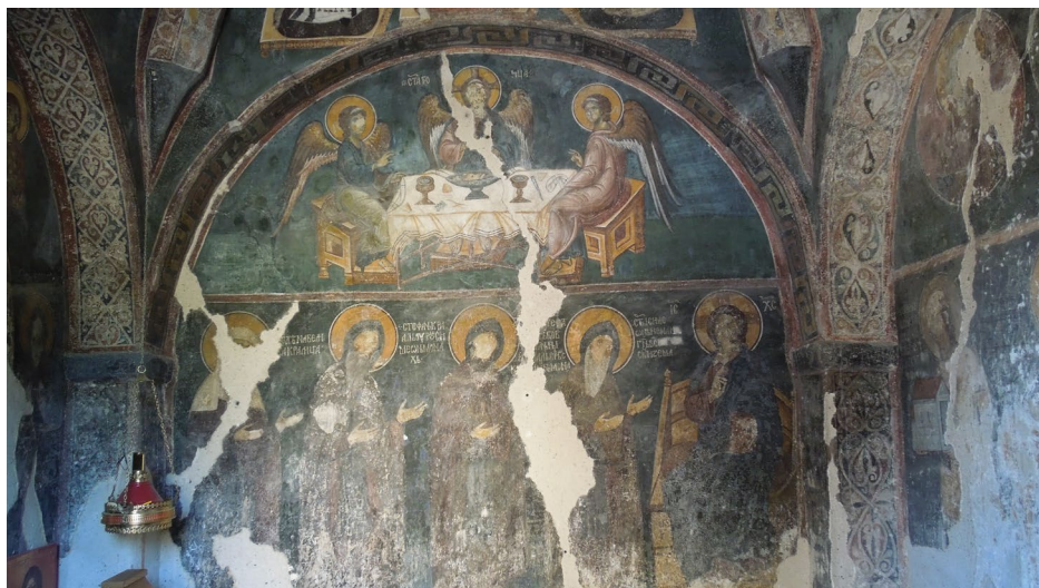
Сл.2. Гостољубље Аврамово, параклис краља Драгутина, Ђурђеви Ступови (1282–1283) Hospitality of Abraham, Parecclesion of King Dragutin Nemanjić, Pillars of St. George (1282–1283)

Овом приликом треба размотрити и један важан пример представе Гостољубља Аврамовог из српске средњовековне уметности који је остао неразјашњен и који такође заслужује посебну пажњу. У питању је фреска Гостољубља Аврамовог из параклиса краља Драгутина у Ђурђевим Ступовима насликана у другој зони јужног зида (1282–1283; sl. 2). 3