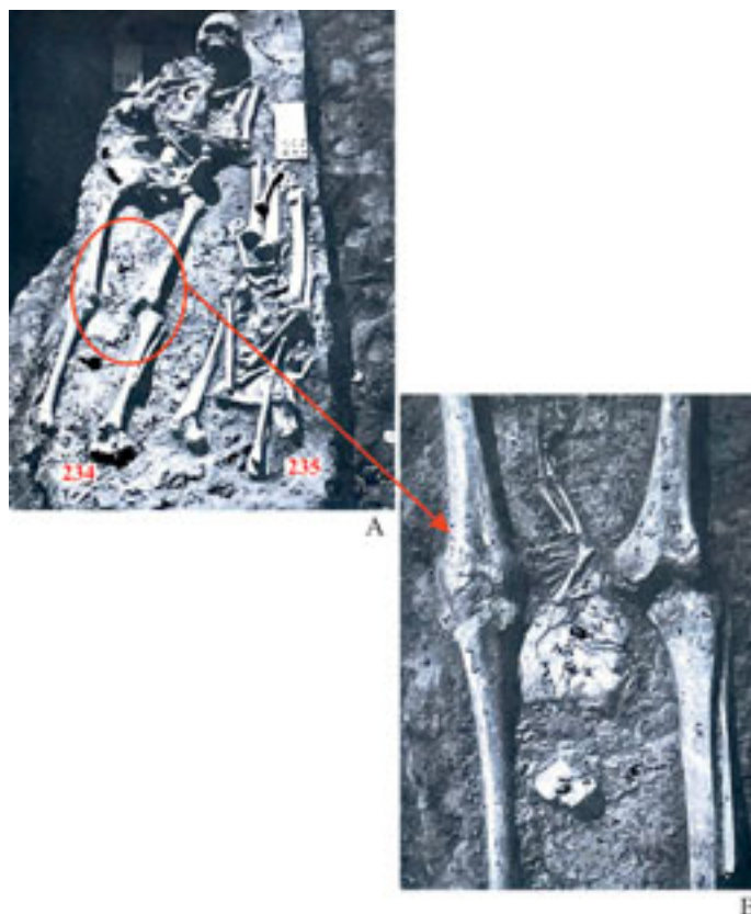
Slika 3. a) Grobovi broj 234 (levo) i 235 (dislocirane kosti desno), preuzeto iz Marjanović-Vujović 1984, T. XXXII/1. b) Grob broj 234: detalj skeletnih ostataka novorođenčeta između kolena odrasle ženske osobe, preuzeto iz Marjanović-Vujović 1984, T. XXXII/2.