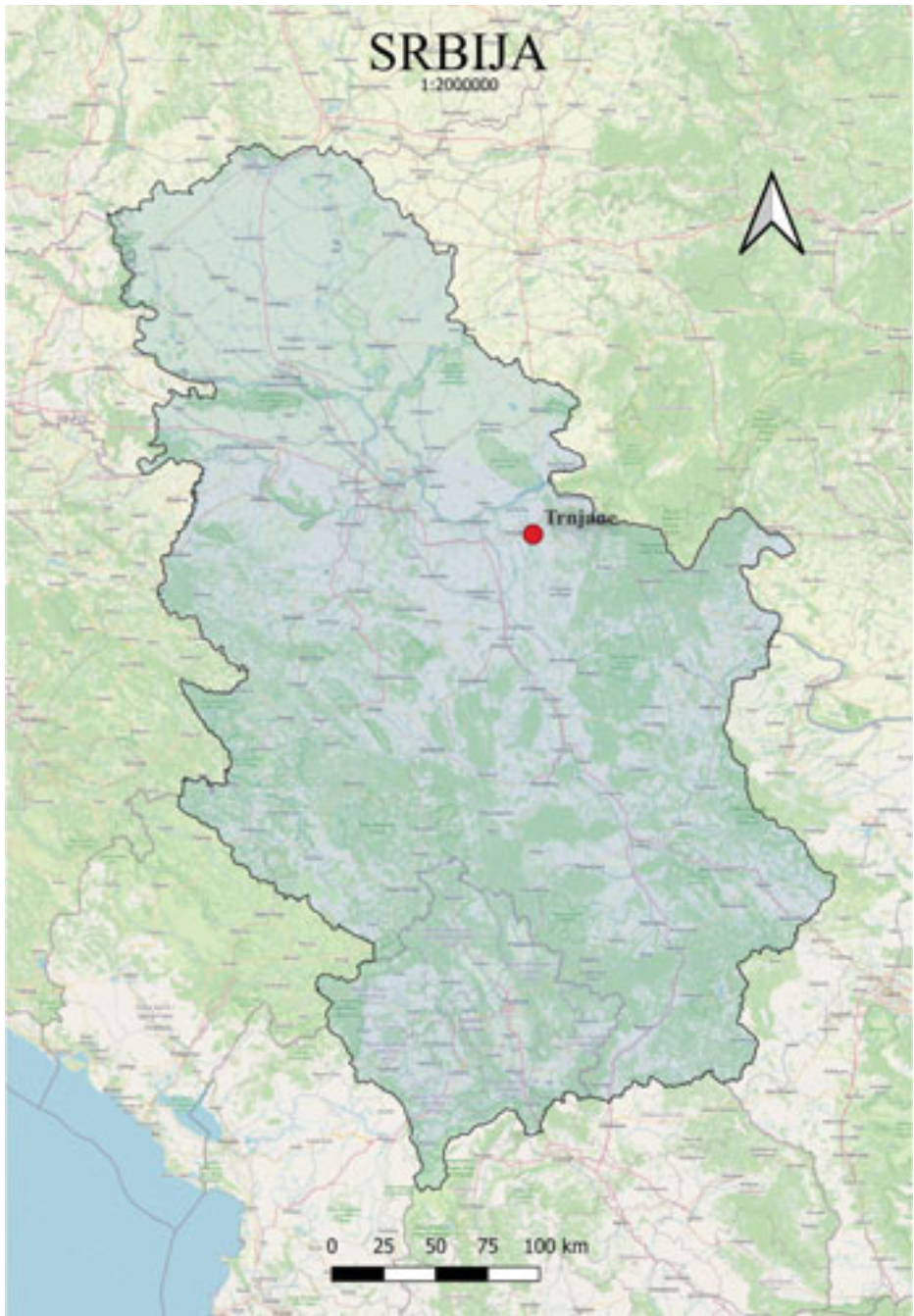
Slika 1. Položaj sela Trnjane (kartu izradio Zoran Radosavljević)