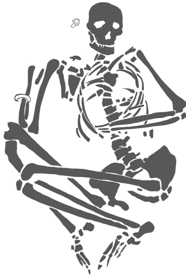
Slika 1. Vizuelizacija pozicije tela individue u grobu br. 344, lokalitet Trnjane