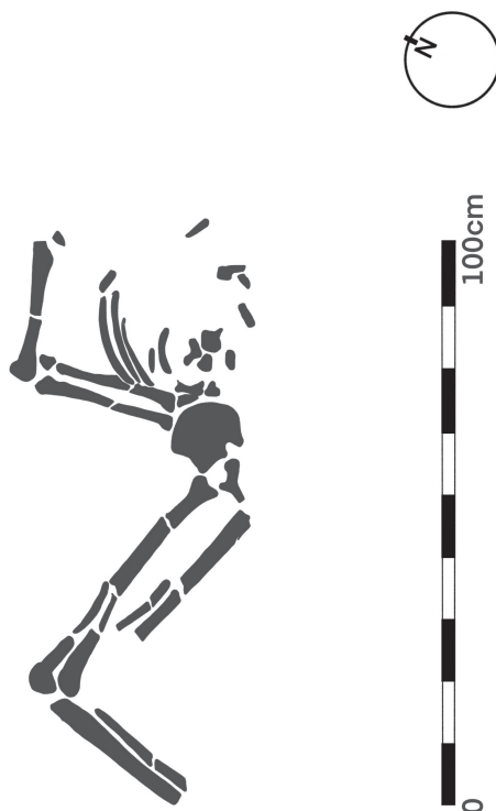
Slika 2. Vizuelizacija pozicije tela individue u grobu br. 41, lokalitet Jakovo, Kaluđerske livade

vić 1986, 199), grobu br. 41 sa lokaliteta Jakovo, Kaluđerske livade (XIII–XIV vek). Milica Janković ističe razloge za blaže grčenje individue u grobu 41 (Slika 2) na istoj nekropoli Jakovo–Kaluđerske livade, pozivajući se na pomenute zaključke Gordane Marjanović-Vujović o infektivnim bolestima. Milica Janković kaže: „Ova pojava prati samrtni grč kod infektivnih bolesti i gotovo na svakom srednjovekovnom groblju, istraženom u većem obimu, postoji po neki takav primer“ (Janković 2003, 103).