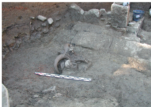
Sl. 2a i 2b. Drugi depozit: iskopavanja sa istočne strane građevine sa svodom iz 2009. i 2008. godine.