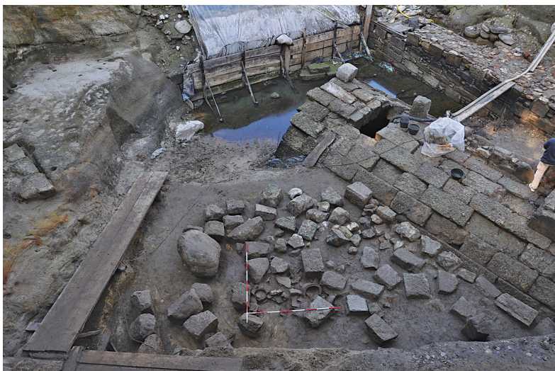
Sl. 1. Prvi depozit: deponija keramike ispod kamenih kvadera sa zapadne strane građevine sa svodom