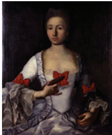
Slika 2: Portret nepoznata dama, sred. 18.stoljeća (MUO 25743)

Stilski odjeća na portretima odgovara sredini 18. stoljeća, kakva je bila prisutna u prikazima plemkinja europskih dvorova. Upravo na portretu grofice Alojzije Janković 6 (slika 1), kao i na portretu nepoznate dame iz Muzeja za umjetnost i obrt (slika 2), prepoznajemo odjevne elemente koji se referiraju na francuski stil Madame de Pompadour . Njega čini specifičan kroj haljine, boja svile 7 , samostalni orukavni ukras od čipke u tri niza – engageantes 8 , ukrasi od mašne, pudrana te visoko na tjemenu češljana kosa s uvojcima 9 . Oblikovanje kose upotpunjavalo se nakitom (broš) ili ukrasom pom-pons 10 , dok su pozamentijske trake na svilenim haljinama istkanim u taft (platno) i atlas vezu, unosile dodatnu dinamiku. Dva portreta Madame de Pompadour François Bouchera 11 iz 1758. i 1759. godine, na najbolji način svjedoče o tom stilu, te će ujedno postati obrazac portretiranja modno osviještenih dama pedesetih godina 18. stoljeća, koje se referiraju na njezine koketne pokrete, način šminkanja i odjevni izgled.