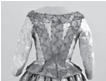
Slika 3: Gornji haljetka, ukras zlatne čipke na batiće, prva pol.18 st. (MUO 6013)

svjedoče dva gornja ženska haljetka od plave i crvene svile (Božanić – Bezić 2003, 11; Pavelić 1955), s ukrasom naknadno aplicirane zlatne i srebrne čipke na batiće, koja su pripadala obitelji Kasandrić na Hvaru. Haljetak od crvene svile čuva se u Splitskom muzeju, dok haljetak od modrog damasta u Muzeju za umjetnost i obrt u Zagrebu (Slika 3). Na njemu zlatna čipka u formi ukrasne trake našivena je na način da prati mjesta spajanja krojnih dijelova te oplemenjuje porub vratnog, lednog izreza te donjeg ruba haljetka. U Dalmaciju se, zahvaljujući dubrovačkim trgovcima, uvozila flamanska čipka koja se prodavala duž cijelog Jadrana (Božanić – Bezić 2003, 10). No i na tom području postojala je i bogata domaća proizvodnja, koju su u većoj količini otkupljivali Venecijanci i prodavali pod nazivom venecijanska (Božanić – Bezić 2002, 239), što uveliko otežava put praćenja čipke dalmatinskog porijekla i njezine primjene u modi ostalih europskih središta.