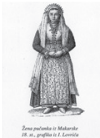
Slika 4: Charles-André van Loo: Madame de Pompadour u robe à la Sultane , 1755. i žena pućanka iz Makarske, 18. st. grafika iz I.Lovrića