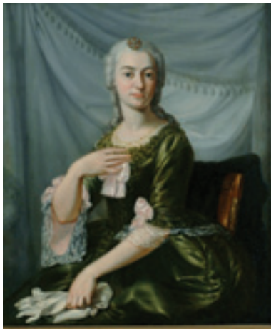
Slika 1: Portret Grofica Alojzija Janković, Gradski muzej Požege, inv. br. U-64