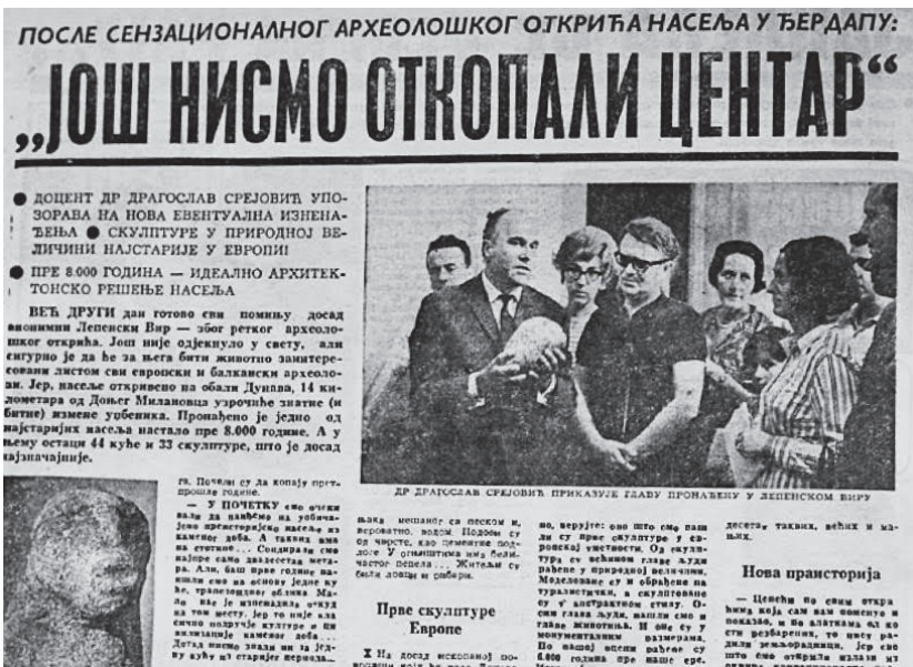
Sl. 1. Velika otkrića Đerdapa I: Lepenski Vir