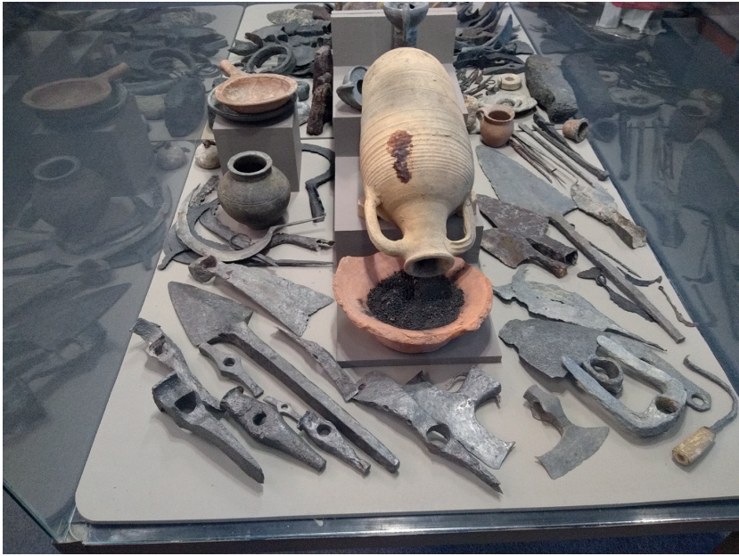
Sl. 4. Postavka u Arheološkom muzeju Đerdapa, 2019. Fig. 4. Permanent display, Archaeological Museum of Iron Gates, 2019

Pretpostavljam u očekivanju muzeja, od izložbe koja je 1978. predstavila stari i nagovestila „bogatstva“ novog projekta, izložbe koje bi prikazale rezultate novih arheoloških napora sve do 1996. godine nisu bile organizovane. Te 1996. godine otvoren je Arheološki muzej Đerdapa, prvi specijalizovani arheološki muzej u Srbiji. Simbolično, na ulaznom zidu postavljena je mapa koja je bila deo izložbe „Stare kulture u Đerdapu“, ali tadašnji princip izlaganja, po nalazištima (Stare kulture 1969), u novoj se postavci Muzeja ne primenjuje. Pod naslovom „Veličanstveno je stajati na obali Dunava“, koji je postao (nad)naslov za sve prezentacije, predstavljena je generalna slika razvoja regije, u hronološkom sledu, sa tipološkim serijama materijala (Sl. 4), u kojoj pojedinačna nalazišta i specifični fenomeni nemaju mesto. Iako se redovno osvežava, dopunjava i menja, stalna postavka Arheološkog muzeja Đerdapa je uvek u istom kodu: monolitna i estetizovana prošlost u kojoj su ilustrovani dometi prošlih kultura (Cvjetićanin 2015a, 569–570; Cvjetićanin 2015b, 366). „Via Traiana“, na primer, postavka realizovana povodom 10 godina Arheološkog muzeja, dopunjena