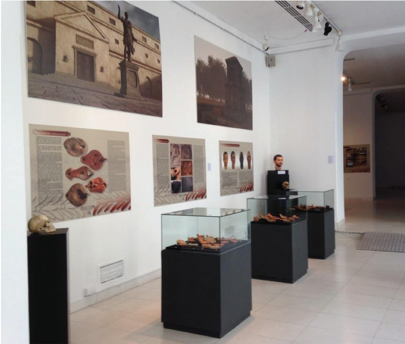
Sl. 7 i 8. Postavka u Narodnom muzeju u Beogradu, 2018. Fig. 7 and 8. Permanent display, National Museum in Belgrade, 2018