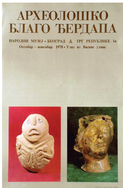
Sl. 2. Plakat izložbe Arheološko blago Đerdapa

Nalazi sa lokaliteta Lepenski Vir bili su u centru pažnje i prve muzejske prezentacije, organizovane u decembru 1967. godine, u Narodnom muzeju, „povodom novootkrivenog naselja u Đerdapu“ (Prodanović 1982, 25, kat. 96), u saradnji sa Arheološkim institutom. U Galeriji Srpske akademije nauka i umetnosti – pretpostavljamo ponovo zahvaljujući Trifunoviću i poziciji koju je imao u savetu novootvorene galerije 9 – održana je 1969. godine izložba „Stare kulture u Đerdapu“, koja je „pružila uvid u petogodišnje istraživačke radove“ i u javnosti popularisala arheologiju (Trifunović 1969). Sledeće predstavljanje rezultata