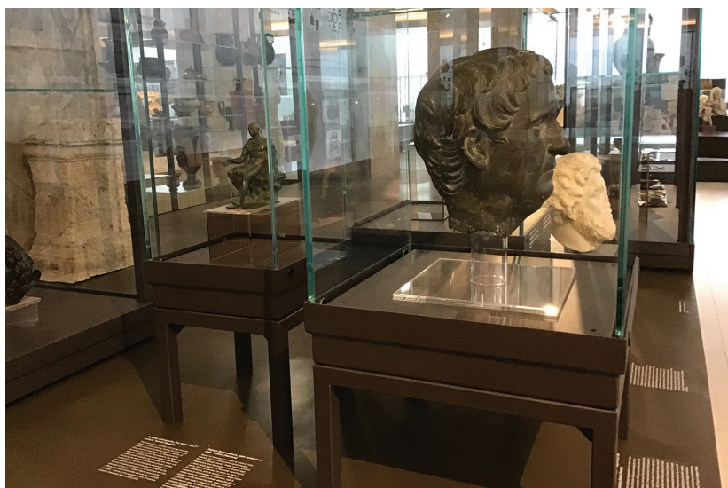
Sl. 5 i 6. Postavka u Narodnom muzeju u Beogradu, 2018. Fig. 5 and 6. Permanent display, National Museum in Belgrade, 2018

U nevelikom vremenskom razmaku u Beogradu su realizovane dve značajne izložbe koje su za temu imale rimske granice: u junu 2018. godine otvorena je nova osnovna postavka Narodnog muzeja u Beogradu, u kojoj važan deo segmenta „Arheologija“ čini rimska prošlost i granica na Dunavu (Borić Brešković 2018, 54–70; Cvjetićanin 2019a), a u avgustu je, povodom pomenutog 24. Međunarodnog kon-