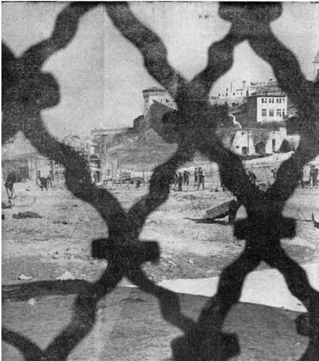
Sl. 5. „Tajanstveni radovi su u toku već duže vremena. Velike table brane pristup na mestu izgrađivanja. Vidi se kako ogromni valjci nivelišu zemlju, kopa se, ruše se neke zgrade... Šta li se tu događa?“ ( Kolo , 4.april 1942.)

kalmegdanskih iskopavanja i Unfercagtov tehnički pristup iskopavanjima će ući i u prvi Priručnik za arheološka iskopavanja (Гарашанин и Гарашнин 1953, 29).