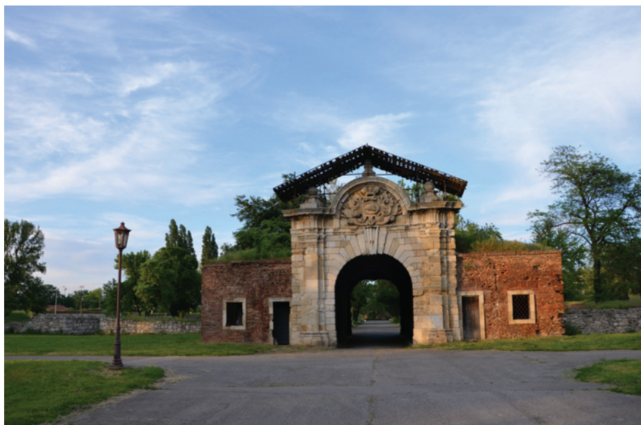
Sl. 6. Kapija Karla VI