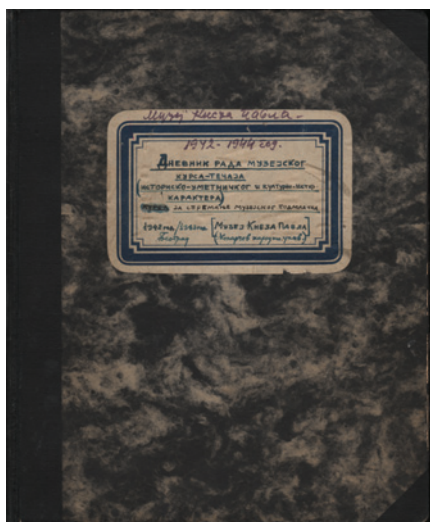
Sl. 1. Dnevnik muzejskog kursa, ANM