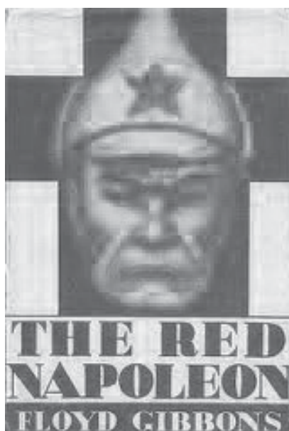
Naslovna strane knjige The Red Napoleon iz 1929. godine

osvajanjima, koja dovode do toga da Amerika ostaje bez saveznika. U ovom scenariju se saveznici karakterišu kao slabi i nepouzdana, što dokazuje stav da se Amerika može osloniti samo na sebe. Ipak, uprkos izolacionizmu, američki heroizam i genijalnost pobeđuju (Esposito 1991, 114-115). Kao što ubedljivo pokazuje Espositova studija, Gibonsov roman nije ni prvo ni poslednje štivo koje se bavi invazijom, ali zaokružuje mit o invaziji i sastavlja ga iz delova koje će činiti mnoge buduće romanizacije i ekranizacije ovog mita.