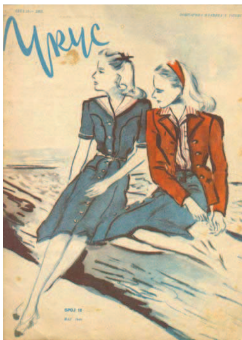
Сл. 2. Одећа у складу са естетиком "пролетерског укуса", Укус , мај 1948.

Свемоћна воља бирократског државног апарата уобличила је женске имице у складу с доминантом конструкцијом рода. Полазећи од тезе да одговарајуће понашање и начини на које се тела удешавају посредством одеће и шминке конституишу идентитет, сексуалност и социјалну позицију (Craig 2000, 46), покушаћемо да реконструишемо преовлађујуће дискурсе у визуелном представљању жена.