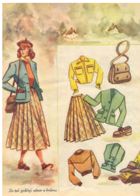
Сл. 1. Одећа за годишњи одмор на планини, Укус , јуни-јули 1949.

Одећа "нове жене" требало да буде бескласна, удобна, практична и лепа. Дефинисању лепоте одеће женска штампа посветила је доста пажње. Магазин Укус одредио је лепо као "ненаметљиво", "скромно" и "солидно". Изједначавањем лепоте са смерношћу, разликовање на нивоу спољног изгледа омеђено је задатим ограничењима која су морала бити интернализована. У новом друштвено-економском систему биле су допуштене само оне дистинкције "које не крше правила доличног и културног владања" (Gronow 2000, 96). Тако је наметнути морал егалитаризма ограничио потражњу за знаковима различитости.