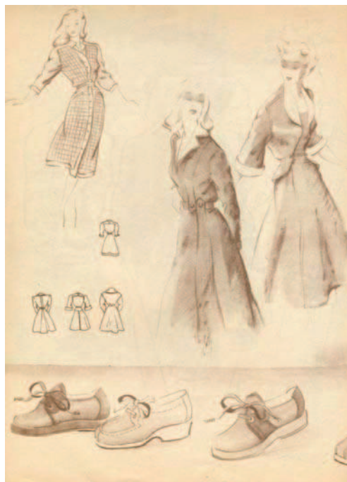
Сл. 3. Идеална обућа за жене, Укус , октобар-новембар 1947.

На карикатури је представљена жена са током украшеном нападном декорацијом и велом преко лица. Улични пси је посматрају и запањено коментаришу њено оглавље: "Гле, и госпођа има корпу" ( Дуга , 8. децембар 1951). Негирање ношења шешира и рукавица, изузимајући прописане прилике, било је у складу са социјалистичким одбијањем канона елеганције. Нов систем забранио је све оно што је екстравагантно, елегантно или извештачено на неки други начин.